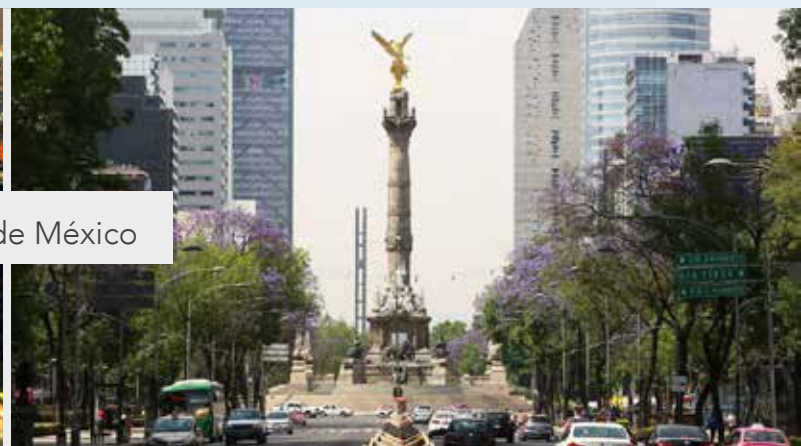
Ciudad de México